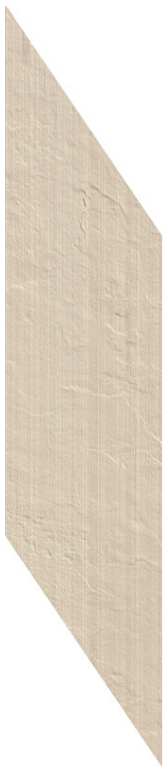
AVORIO (Ivoire) 18.75 x 57.6 cm (7 x 23) Chevron OE.AM.AVO.0723.CHEV