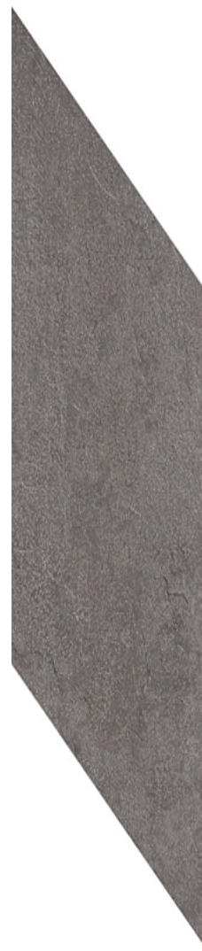
ANTHRACITE 18.75 x 57.6 cm (7 x 23) Chevron OE.AM.ATR.0723.CHEV

Tous les items présentés dans ce document font partie du programme d'inventaire Olympia. Pour les commandes spéciales, veuillez contacter votre représentant de Tuiles Olympia.