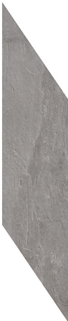
CENERE (Gris) 18.75 x 57.6 cm (7 x 23) Chevron OE.AM.CNR.0723.CHEV